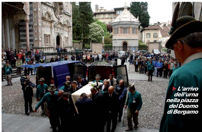
► L'arrivo dell'urna nella piazza del Duomo di Bergamo