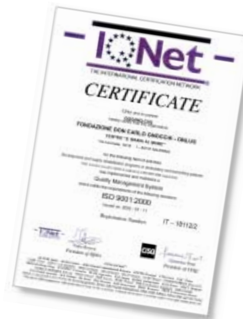
A fianco, il certificato, rilasciato dall’Ente di Certificazione IMQ-CSQ il 30 novembre 2001.

A testimonianza dell’impegno per il miglioramento continuo della qualità delle prestazioni erogate, il Centro ha ottenuto la certificazione UNI EN ISO 9001:2000 dall’Ente di Certificazione IMQ-CSQ per lo “Sviluppo ed erogazione di progetti riabilitativi in regime ambulatoriale e domiciliare”.