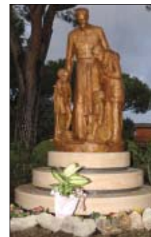
Nelle due foto in alto, immagini della solenne inaugurazione del Centro “S. Maria della Provvidenza”, avvenuta il 28 febbraio 2004, alla presenza del cardinale Angelo Sodano. A fianco, la statua di don Gnocchi posata e benedetta nell'occasione